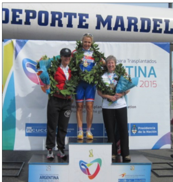
Fière gagnante d'une médaille de bronze, vélo 20 km. Merci à mon donneur et à mes supporteurs, dont l'équipe de Transplant Québec qui m'a procuré ce magnifique maillot!

Pour moi, les Jeux, qu'ils soient mondiaux ou canadiens, représentent une série de belles rencontres, de coïncidences agréables et d'histoires de vie extraordinaires.