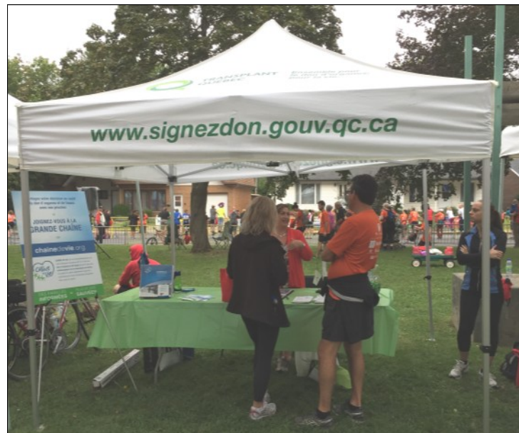
Des participants s'arrêtent au kiosque de Transplant Québec pour en connaître un peu plus sur le don d'organes. La majorité des personnes rencontrées avaient déjà signifié leur consentement au don d'organes, mais plusieurs n'en n'avaient pas encore parlé à leurs proches.

Pour chaque inscription, les participants choisissaient de faire un don à un organisme appuyé par Desjardins, dont Transplant Québec. Les dons reçus par Transplant Québec seront versés au projet CHAÎNE DE VIE. Merci pour cette belle collaboration!